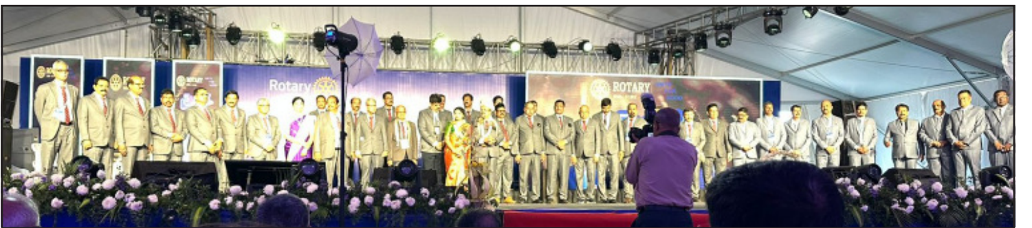
Introduction of next year team by DGE Rtn BM Bhat.