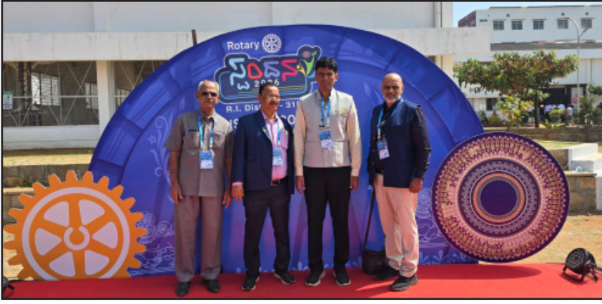
ತಾರೀಖು 23 ರಿಂದ 25 ಜನವರಿವರೆಗೆ ಹಾಸನದಲ್ಲಿ ನಡೆದ ಜಿಲ್ಲಾ ಸಮ್ಮೇಳನ "ಸ್ವಂದನ 2026" ರಲ್ಲಿ ನಮ್ಮ ಕ್ಲಬ್ಬಿನ 21 ಸದಸ್ಯರು ಭಾಗವಹಿಸಿದ್ದು, 26 ಸದಸ್ಯರು ನೋಂದಣಿ ಮಾಡಿರುತ್ತಾರೆ